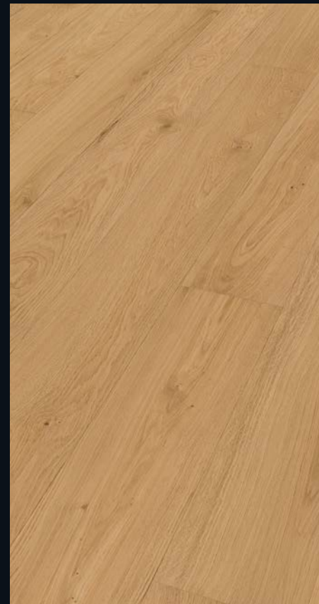
Eiche markant pure gebürstet 9047