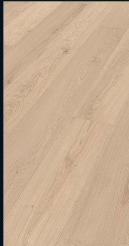
Eiche markant cremeweiß gebürstet 9048