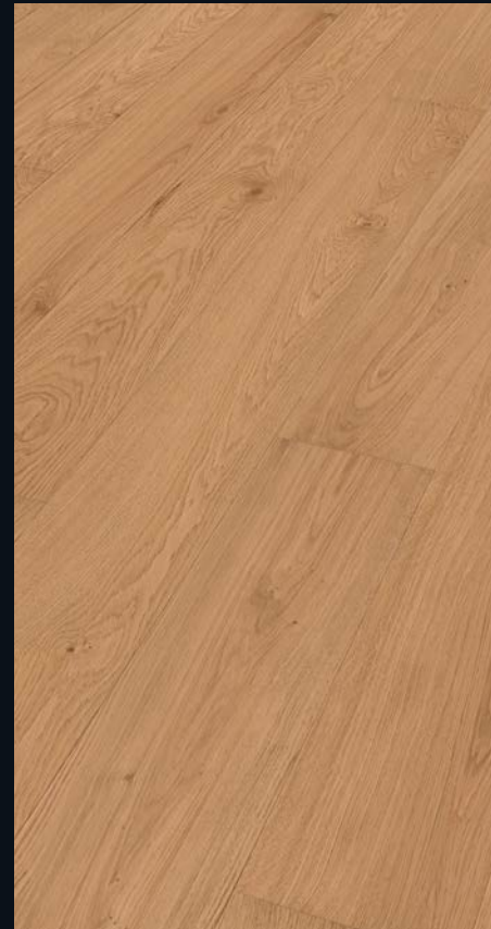
Eiche markant gebürstet 9025