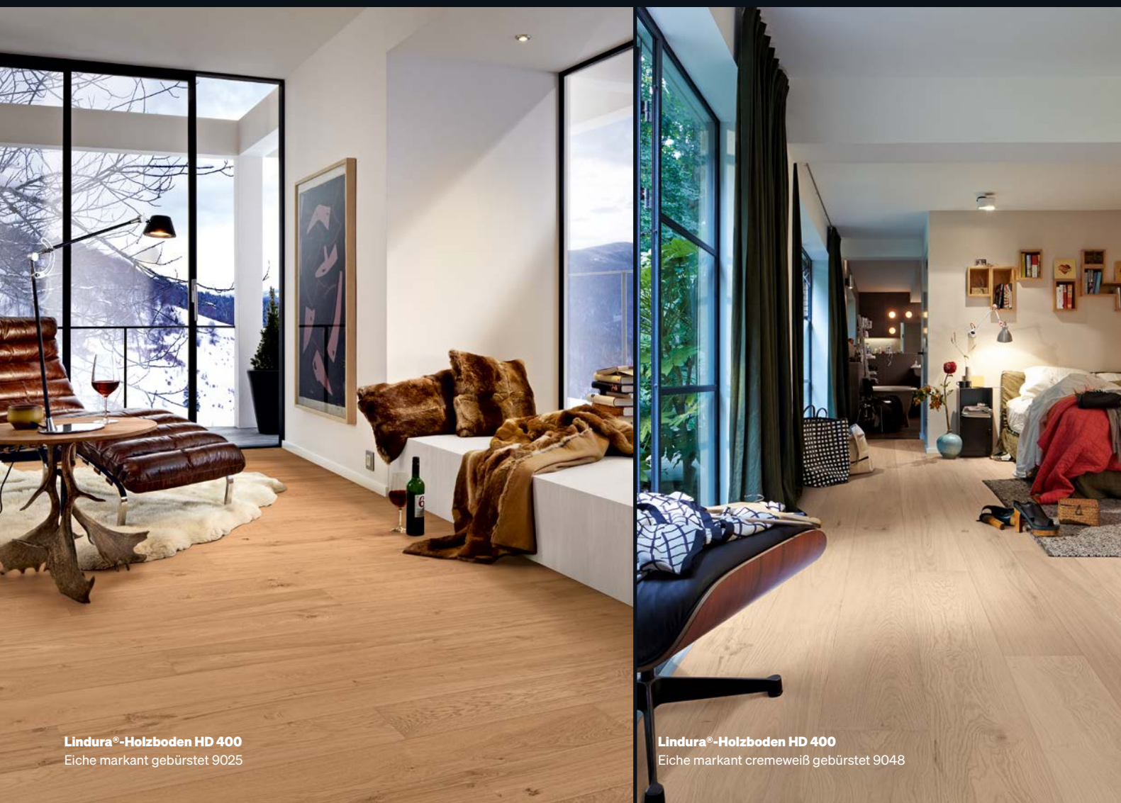
Lindura®-Holzboden HD 400 Eiche markant gebürstet 9025